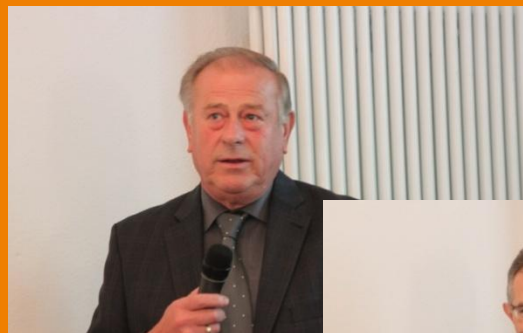
Lob von der Politik...