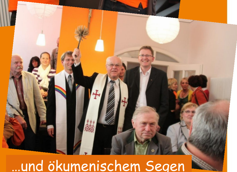
...und ökumenischem Segen