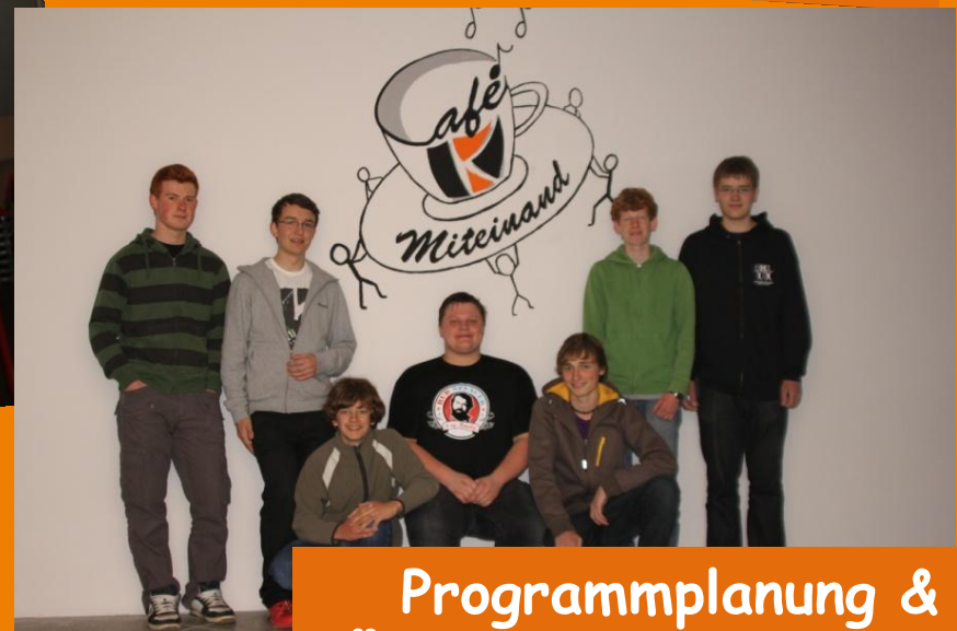
Programmplanung & Öffentlichkeitsarbeit