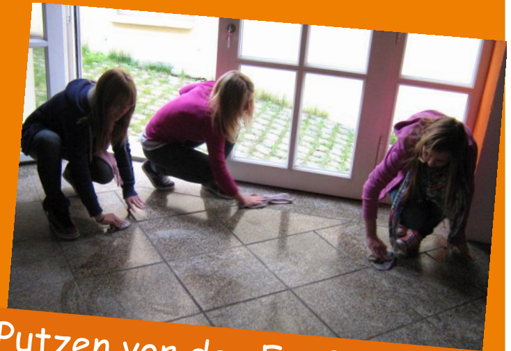
Putzen vor der Eröffnung