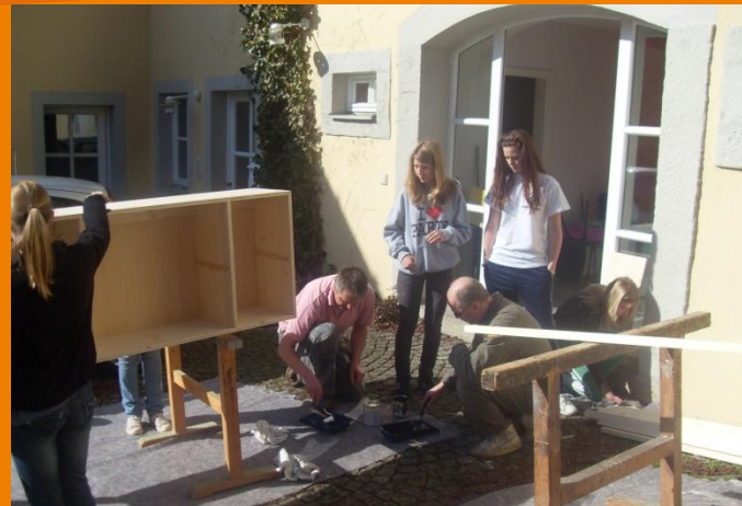
Möbel lackieren und Zusammenbauen